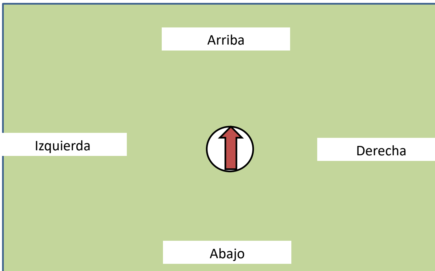
Imagen de referencia para la construcción: