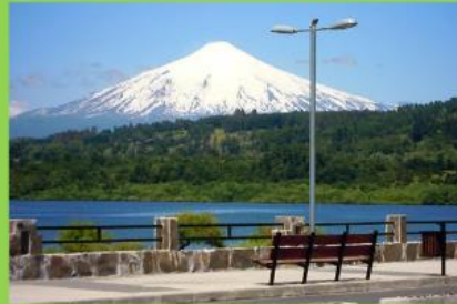
Villarica, Región de la Araucanía

Zona Austral: Abarca desde el Golfo Corcovado hasta el extremo sur de Chile.