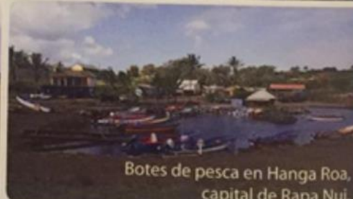
Botes de pesca en Hanga Roa, capital de Rapa Nui.

La isla Rapa Nui tiene un paisaje tropical. Existen altas temperaturas y gran cantidad de precipitaciones.