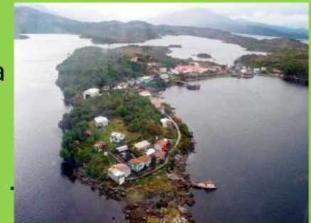
Puerto Edén, Región de Magallanes y la Antártica Chilena

Zona Austral: Abarca desde el Golfo Corcovado hasta el extremo sur de Chile.