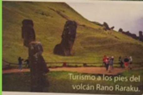
Turismo a los pies del volcán Rano Raraku.